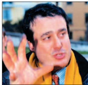
Il vice questore della polizia Giovanni Aliquò

«Negli ultimi cinque anni qualcosa come il 30 per cento. Il che significa con svalutazione e tutto il resto che è una cifra piuttosto elevata. Il fatto è che oggi noi ci